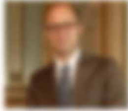
Nome e Cognome del professionista