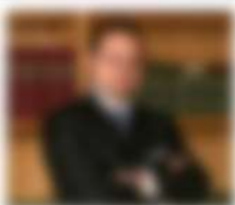
Nome e Cognome del professionista