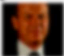
Nome e Cognome del professionista