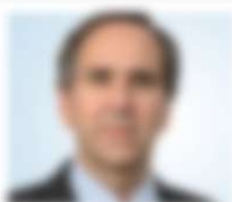
Nome e Cognome del professionista