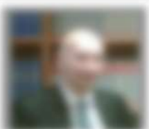
Nome e Cognome del professionista