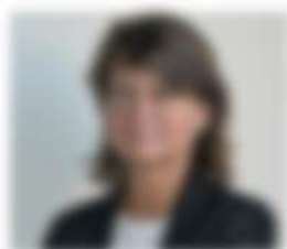
Nome e Cognome del professionista