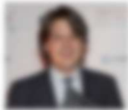
Nome e Cognome del professionista