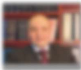
Nome e Cognome del professionista